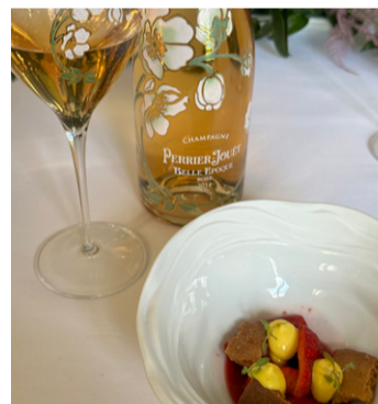
Macaronade aux fraises