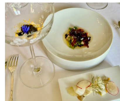
Caviar osciètra, Gras de seiche, Geles de boeuf ambrée