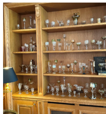
Coleção de taças vintage