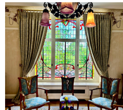
Vitrais em Art Nouveau