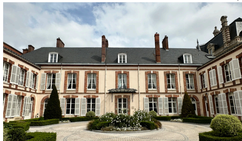
Maison Belle Epoque

Mais experiências gastronômicas no www.degustatividade.com.br