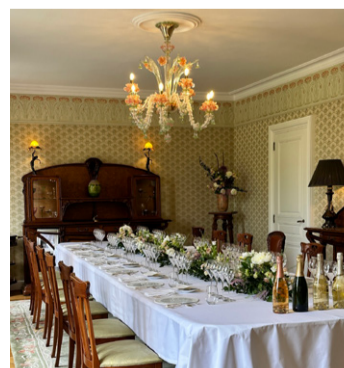
Salão privativo Maison Belle Epoque