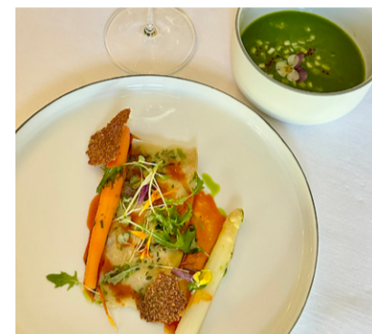
Pointe d'asperge blanche, Velouté Argenteuil